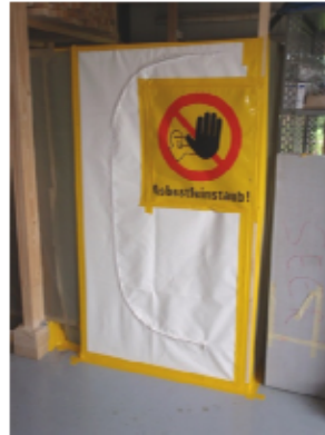
5 Sauber abgetrennter Arbeitsbereich