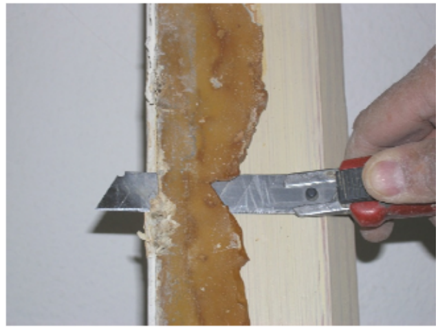
4 Abtrennen des Kitts von der Unterlage mit einem Japanmesser