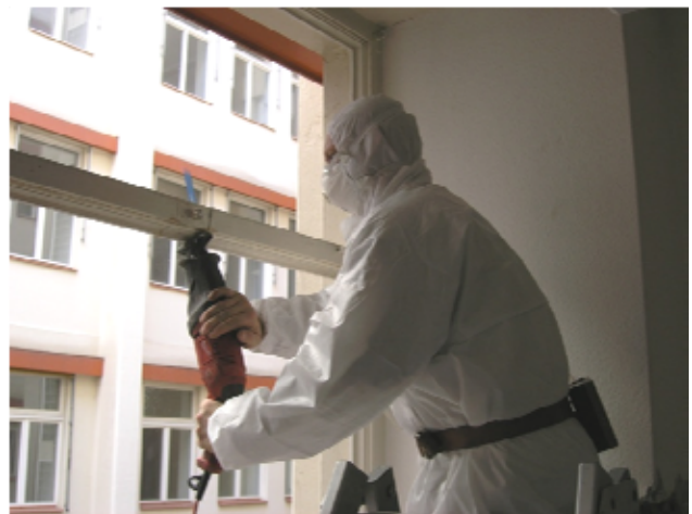
1 Aufschneiden des Fensterrahmens mit einer Fuchsschwanzsäge

Beim Entfernen von asbesthaltigem Anschlagkitt mit Handwerkzeugen wie Spachtel oder Stechbeitel ist mit einer erhöhten Freisetzung von Asbestfasern zu rechnen. Instruierte Baufachleute können die Arbeiten ausführen, wenn das hier beschriebene Verfahren eingehalten wird.