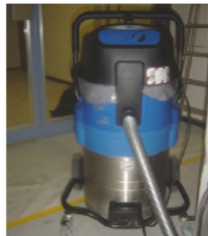
2 Industriestaubsauger mit Filter für Staubklasse H (Asbest)