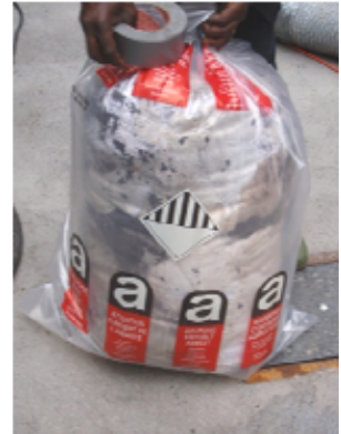
6 Kunststoffsack mit der Kennzeichnung Asbest