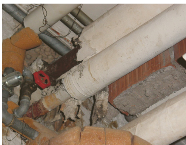
1 Rohrisolation mit asbesthaltigem Mörtel

Besteht der Verdacht, dass beim Entfernen oder Bearbeiten von isolierten Rohrleitungen Asbest auftreten kann, so müssen die Gefährdungen vor Beginn der Arbeiten genau ermittelt werden.