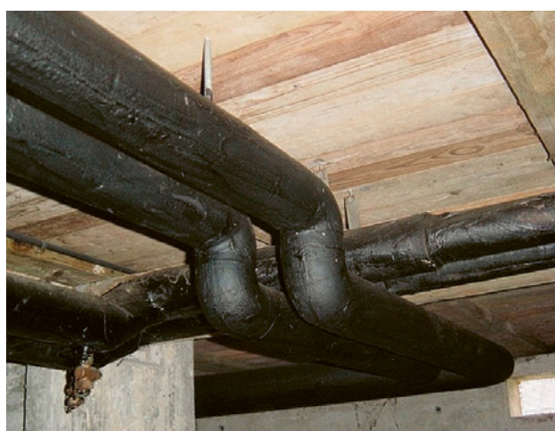
2 Rohrisolation mit asbesthaltigem Bitumenanstrich